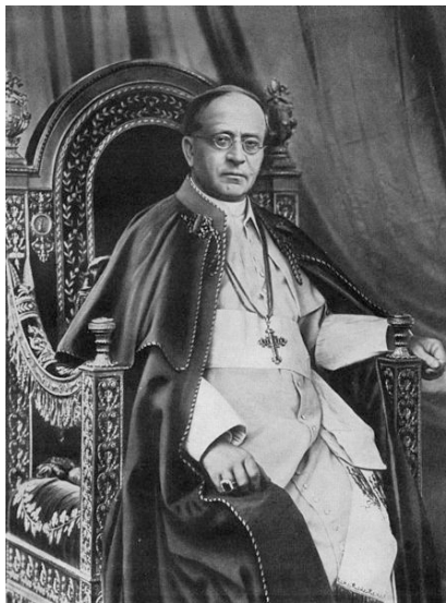
Papst Pius XI

Papst Pius XI fällt im August 1931 dazu seine Entscheidung „Super Controversia“. Dieses Dokument legte nun endlich - nach Jahrhunderten