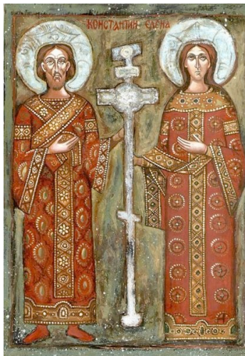
Konstantin und Helena

Nachdem Konstantin der Große das Christentum als Religion 313 erlaubt