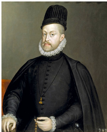
König Philipp II

Nicht ganz vierzig Jahre später, in einer politisch stark veränderten Welt, versuchten Jerusalempilger und Ritter vom Heiligen Grab - wie es sie in Flandern traditionell immer wieder gab, neue Impulse zu setzen.