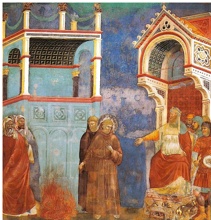
Der heilige Franziskus vor dem Sultan

Nach dem endgültigen Ende des Lateinischen Königreiches (meist mit dem Fall Akkos 1291 definiert) gelang es den seit Franziskus immer wieder im Heiligen Land tätigen Franziskanern durch ihre Hartnäckigkeit 1333 die Erlaubnis des Sultans von Ägypten zur Errichtung eines Konvents zu erreichen.