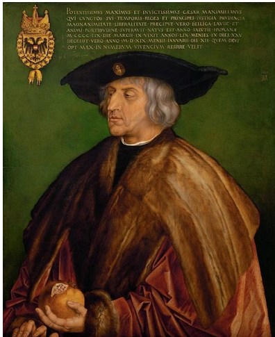
Kaiser Maximilian I

Wie im „Herbst des Mittelalters“ von Huizinga so eindrucksvoll dargestellt, geht mit dem Tod von Kaiser Maximilian I eine