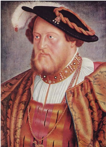
Ottheinrich von der Pfalz

Kulturgeschichtlich gesehen sehr verspätet pilgerte der geniale Wittelsbacher Pfalzgraf Ottheinrich von der Pfalz nach Jerusalem.