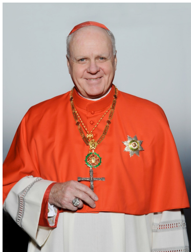
Kardinal-Großmeister Edwin O'Brien